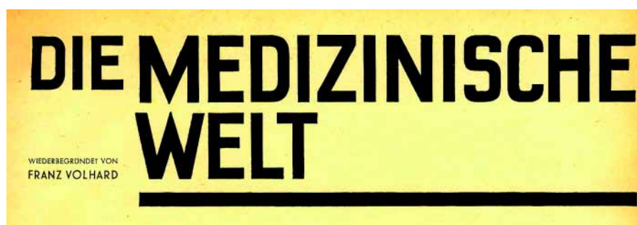
Abb. 4 Rückkehr zum ursprünglichen Titel im Jahr 1951

Heute leben wir in einer Wirtschaftskrise und parallel haben wir eine selbstgemachte Reformkrise im Gesundheitswesen, die weitere Reformen nach sich ziehen wird – warten wir sie ab oder gestalten wir sie im Rahmen unserer Möglichkeiten.