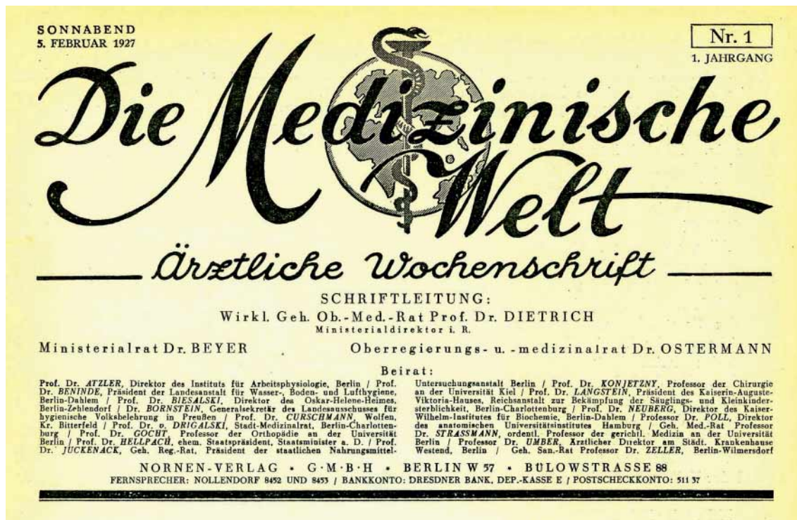
Abb. 2 Titelkopf der Erstausgabe der „Die Medizinische Welt“ von 1927 – das Motiv der Weltkugel findet sich seit der Dezember-Ausgabe 2005 wieder auf der Titelseite.

Ein Ziel, dem die „Med Welt“, getreu ihres Untertitels, bis heute treu geblieben ist: „Aus der Wissenschaft in die Praxis“.