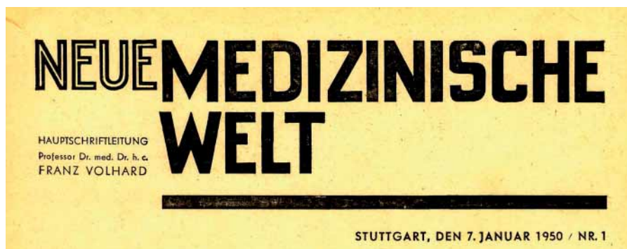
Abb. 1 Ausschnitt der Titelseite der Erstausgabe der „Neue Medizinische Welt“ vom 7. Januar 1950

„...sie will die Zeitschrift des in der Praxis stehenden Arztes – auch des Facharztes und des Klinikers – sein. Rein theoretische Probleme sollen hier nur erörtert werden, soweit sie für den Praktiker interessant und wichtig sind. In der ‚Neuen Medizinischen Welt‘ soll in erster Linie praktische Medizin abgehandelt werden.“