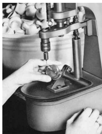
Fig. 1 How teats used to be made back in the 1950s, semi-automatic perforation of bottle teats.

At present in Germany, one in two children has to undergo corrections to the jaw and tooth area. “Distal occlusion of the mandible is the most commonly observed anomaly, at around 21% in the deciduous and mixed dentition,” reported Dr. Thomas Stamm , orthodontist from the Uni-