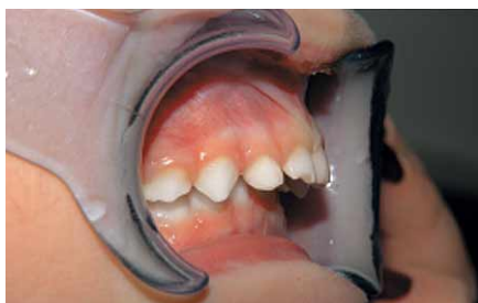
Fig. 2 Teeth of a three year old boy with pronounced distal occlusion.

versity Hospital of Münster. According to Prof. Ariane Hohoff , orthodontist from the same university hospital, the main reasons for this, apart from a genetic component, are habits such as thumb sucking or prolonged use of pacifiers.