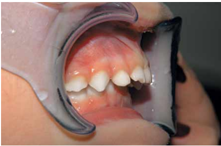
Abb. 2 Gebiss eines dreijährigen Jungen mit deutlicher Distalokklusion

genetischen Komponente besonders sogenannte ‚Habits‘ wie Daumenlutschen oder eine prolongierte Benutzung von Beruhigungssaugern.“