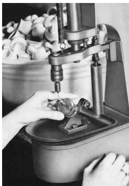
Abb. 1 Historische Saugerfertigung aus den 1950er-Jahren, halbautomatische Lochung von Trinksaugern